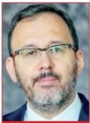
M. Muharrem Kasapoğlu

G ENÇLERİN 81 ildeki bakanlık yurtlarında ücretsiz konaklamasını sağlayan "Seyahatsever" projesi, yoğun talep görünce uzatıldı. Müjdeyi Gençlik ve Spor Bakanını Mehmet Muharrem Kasapoğlu