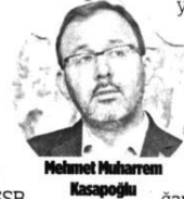
Mehmet Muharrem Kasapoğlu

ücretsiz kullandıkları yurtlardaki konaklamaların 1 Eylül'de sona erdiğini ancak bu sürenin uzatıldığını aktararak, "Hafta sonuna seyahatseverlere müjde vererek başlamak istiyorum. GSB yurtlarında 5 gün ücretsiz konaklama imkanı sunan Seyahatsever projemizi 1 Eylül'den 5 Eylül'e uzatıyoruz. Projemizden